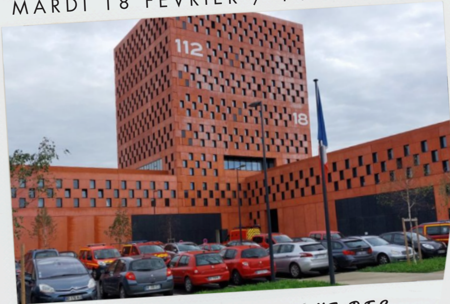
VISITE DE LA CASERNE DES POMPIERS